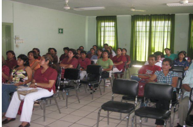
Profesionales participantes en taller de capacitación