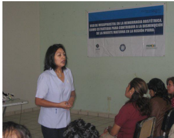
Coordinadora de la Estrategia de Salud Sexual y Reproductiva

La Estrategia Sanitaria de Salud Sexual y Reproductiva brindó facilidades para la capacitación al personal profesional de 11 micro redes de salud en “Uso del Misoprostol como estrategia para la reducción de la Muerte Materna”. El personal capacitado fue de los siguientes grupos profesionales: Médicos ginecólogos, 05 profesionales; Médicos generales, 35 profesionales; y Obstetras, 60 profesionales.